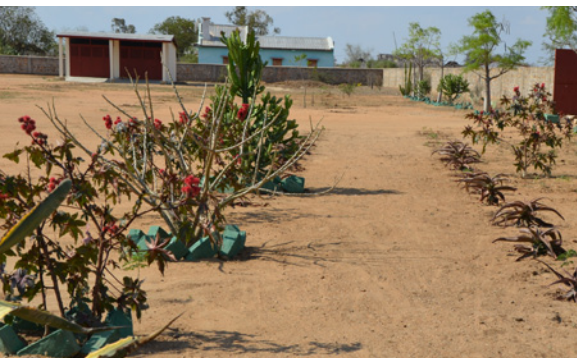
Bepflanzung auf dem ADES-Gelände in Ejeda

Ende 2010 ist die Idee entstanden, in Ejeda ein grünes Zentrum aufzubauen – eine etwas gewagte Idee. Denn der Süden Madagaskars ist hart und unwirtlich, zwar reich an Bodenschätzen und ausgestattet mit einer ganz speziellen Flora, dem Trockenwald des Südens, jedoch mit schwierigen Lebensbedingungen für die Bewohner, die Mahafalys. Lange Trockenperioden, die mehrere Monate oder gar Jahre dauern können, wechseln sich ab mit übermässigen Regenfällen, die ganze Landstriche unter Wasser setzen. Und die Verbindungswege, die durch dieses Gebiet führen, sind Schotterpisten oder Sandwege mit metertiefen Löchern. Vor einem Jahr erst ist es uns gelungen, dank einer grosszügigen Spende einer deutschen Stifterin ein Wasserloch zu bohren, das uns mit genügend Wasser versorgt, um unser Gelände von einem Hektar Grösse regelmässig zu bewässern. Wir mussten zwar 30 Meter tief bohren, bis wir Erfolg hatten. Aber dank dieser Wasserstelle können wir ganz neue Ideen entwickeln und umsetzen.