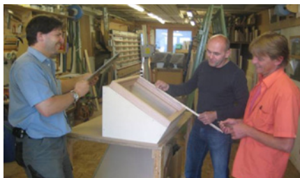
Das Team der sommer holzwerkstatt beim Vermessen eines Prototyps

Die sommer holzwerkstatt produziert den ADES-Solarkocher gemeinsam mit der Institution «Einstieg in die Berufswelt», einem Arbeits- und Bildungsprogramm für stellensuchende Jugendliche im Kanton Zug. Die Endfertigung wird dort durch Jugendliche vorgenommen, die sich auf diese Weise fit machen können für eine Lehrstelle. So profitieren junge Leute in einer schwierigen Lebenssituation direkt von dieser Initiative.