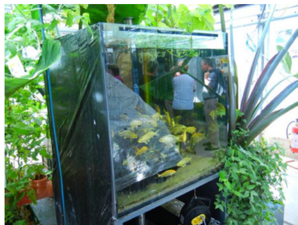
Aquaponic: Ein integriertes Verfahren für die Fischzucht, entwickelt an der ZHAW

(ZHAW) auf dem Programm. Die ZHAW betreibt «grüne» Forschung auf höchstem Niveau, wovon sich die interessierte Zuhörerschaft anschliessend gleich selber überzeugen konnte. Unter anderem präsentiert wurde die innovative HTC-Biokohle, die aus einem hydrothermalen Prozess resultiert, sowie das Aquaponic. Hierbei handelt es sich nicht etwa um eine Reittherapie mit Wasserponys, sondern um integrierte Kreislaufanlagen für Fisch- und Pflanzenproduktion.