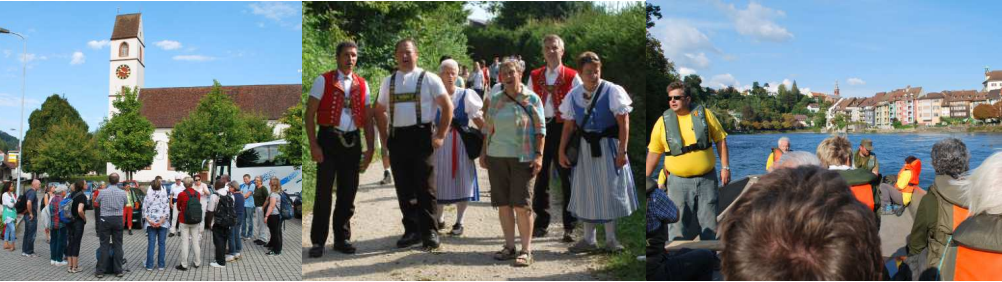
Start: Mettau, AG. - Unterwegs: Appenzeller Jodel. - Schluss: im Boot vor Laufenburg.