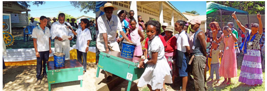
Feierliche Ansprache und ein ausgelassenes Freudenfest für alle neuen Kit-Besitzer.

Unter dem Vorsitz des italienischen Rotary Clubs Torino Dora haben - nach erfolgreichen Aktionen anderer Clubs dieses Jahr - auch die Rotarier von Lausanne, Lyon, Barcelona und Stuttgart insgesamt über 8'000 Euro