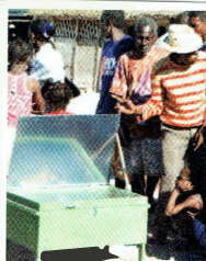
Madagaskar: Kochen mit der Sonne

Der Rotary Club Zurzach-Brugg beteiligt sich an den Kosten dieses Projektes und setzt sich bei einem «Hands on» Einsatz der Mitglieder auch selbst für die Realisierung ein.